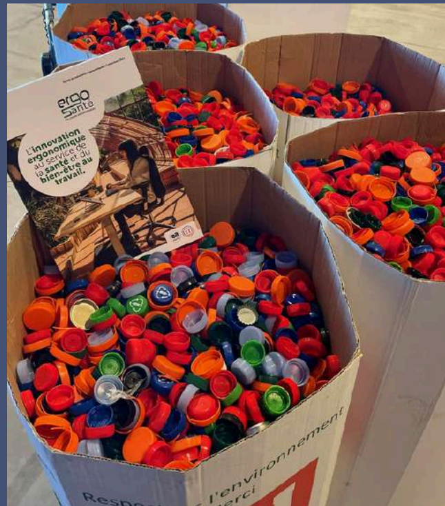
Collecte de bouchons en plastique par ErgoSanté dans les points de restauration de la Sud de France Arena.