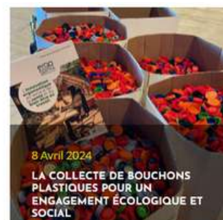
Feed d'actualités du site internet de la SPL Occitanie Events

Coté prestataires et partenaires , en plus de la réunion annuelle, nous avons mis en place en 2023 un questionnaire de satisfaction . 100% de nos principaux partenaires et prestataires connaissent et comprennent notre démarche.