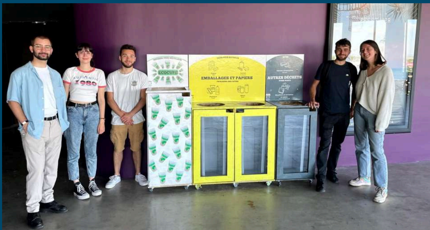
Prototype de poubelle de tri installé dans les coursives de la Sud de France Arena par les étudiants de l'École d'ingénieurs EPF de Montpellier