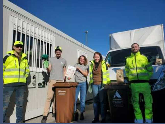
Collecte et compostage des déchets alimentaires du site par les Alchimistes.

avec une transformation locale en compost grâce à l' amélioration de nos process et la sensibilisation.